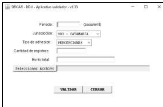
Aplicativo Validador de los archivos a adjuntar en las DDJJ

Para ejecutar este programa deben tener instalado en el equipo la Máquina Virtual de Java , si no la posee puede descargarla desde el siguiente sitio: http://www.java.com/es/ .