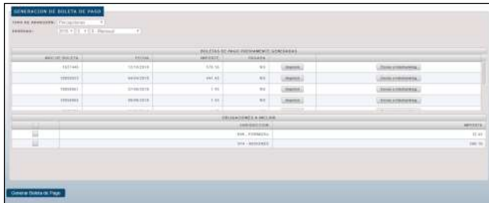
Permite crear una nueva boleta de pago y se muestran las existentes y pendientes de pago.

En el caso que igualmente se verifique necesaria la generación, se debe elegir la o las jurisdicciones a incluir (muestra únicamente las jurisdicciones en las cuales se detecta un saldo a pagar, NO muestra otras jurisdicciones donde se hubiera presentado DDJJ y no de monto a pagar), y luego presionar el botón Generar Boleta de Pago para seguir con el proceso.