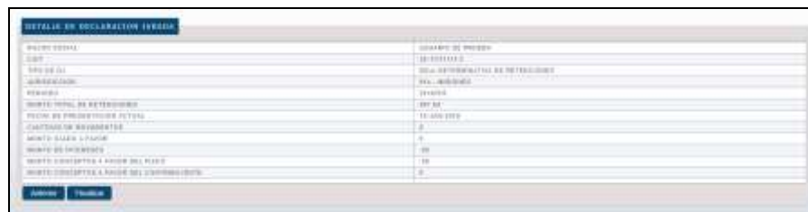
Solicitud de Confirmación de los datos enviados.

Una vez que el Sistema valida que todos los datos ingresados son correctos de acuerdo al archivo con el detalle adjunto, se muestra una pantalla resumen donde se le solicita al Agente la confirmación de la operación que va a realizar.